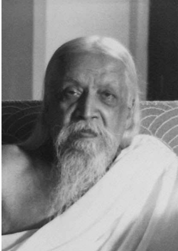
Sri Aurobindo — 1950